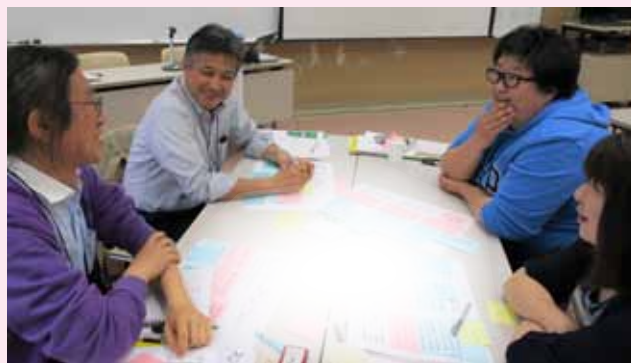
昨年のワークショップの様子