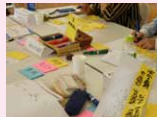
組織の課題を深掘りしながら、課題の根本を捉えるワークを行います。