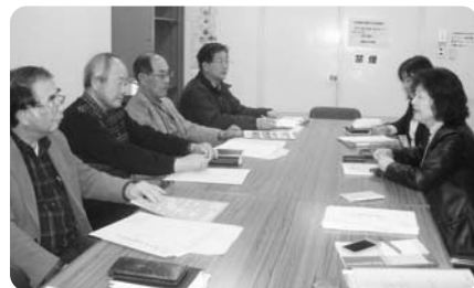
▲プログラム開始に向け打合せ

(株)損害保険ジャパン(以下、損保ジャパン)は、紙の使用量・CO2排出量の削減につなげたいと、昨年からはインターネットで約款が見られるサービスを実施しています。