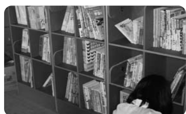
▲強化ダンボールでできた本棚

絵本を届けた際、絵本を収納する棚がなく、カゴやダンボールに入れられている状態を目にしました。また、仮設住宅では、本の置きようがないといった話を聞きました。