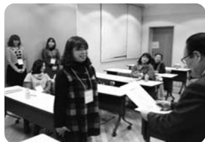
▲MC講座で修了証を手渡す

NPO法人となり、二月二十日からインターネットを通じて動画や音声配信するサービスUSTREAMで配信を開始しました。そして今年の夏の開局を目指し、新たに大崎市七日町に事務局も設けました。