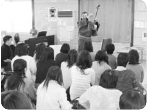
▲絵本作家のトークライブ

そのほかあゆむネットでは、人形劇や絵本作家の読み聞かせ、落語の公演など「こーディネット」、沿岸部の保育園や幼稚園、小学校などで行いました。さらに、日本財団と東京都から助成を受け、子どもを日常を支える母親や保育者の支援もしています。「こころほかほかアートサロン」と題し、仙台市内で一般の母さん向け、石巻、亘理の保育所で保育士さん向けのワークショップを開いています。親子で組み木を作るものや、羊毛でボールとマット作りなどを三月までに行い、好評を得ています。