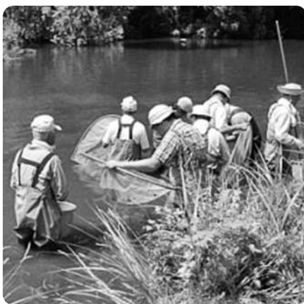
▲水源池の生き物調査

やゼニタナゴをなぜ守らなければいけないのか、それがどのように自然に関係しているのか。もうきれいな小川で遊ぶ機会がなくなった、都会の子どもたちにとって、その大切さを学び、まだ守れる環境を残している鹿島台の地域を守る重要性に気づく機会となるよう、シナイモツゴ郷の会と杜の伝言板ゆるるが、協力して、取り組んでいきます。 ※「水辺の貴重な生き物観察会」は、Back Pageをご覧ください。