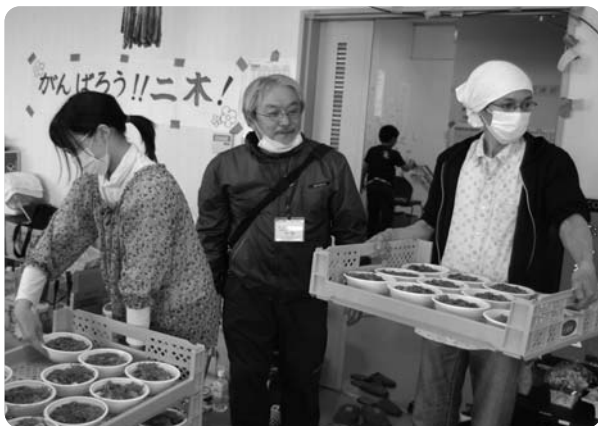
▲避難所での炊き出し

援をしている青葉区、太白区、若林区の施設で暮らす人たちのもとをまわり、翌日は路上などで暮らすホームレスの人たちを訪ね歩き、安否確認を行いました。幸いなことに水とプロパンが使えたので、十四日からは、「とにかく蓄えてある物資と燃料がある間は食料を提供しよう」と、文化町の事務所の前で約千食分のカレーと豚汁を作りました。食べられない人への支援という日頃の活動の本領発揮です。備蓄は二、