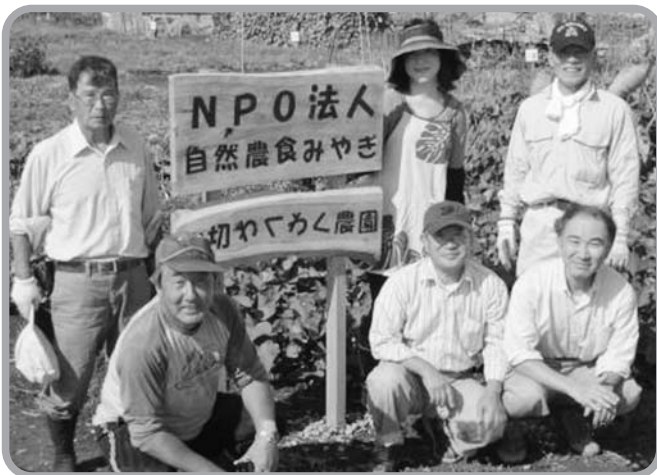
▲ NPO法人自然農食みやぎ