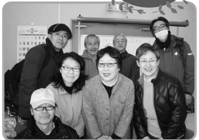
▲ NPO法人仙台夜まわりグループ