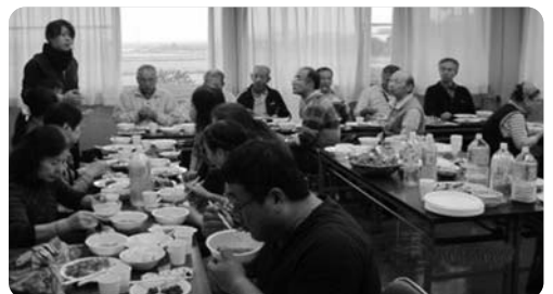
▲ 収穫した野菜を味わう

ことに、ヘドロは有用な有機資材になることを理解しており、このことを本部に進言した結果、EM研究機構の「EM災害復興支援プロジェクト」の協力を得て、UNET本部からの