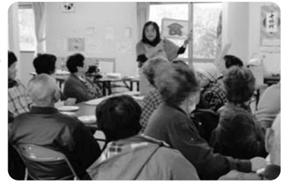
▲食についてのお話

と、これからの 対策のため 食事調査と栄 養指導に当た りました。そ の際、一定量 の食材を届け たり、均等に 行きわたるよ う仕分けをし たりすること は、個人で行 うには限界があり、組織として支援を行 わなければと気づかされました。そし て、食事は支援物資だけだったために、 栄養バランスに偏りがあり、「食改善が 必要だ」と感じ、これは気仙沼だけでな く、県内の被災した人全てが当てはまる のでは、と考えるようになりました。