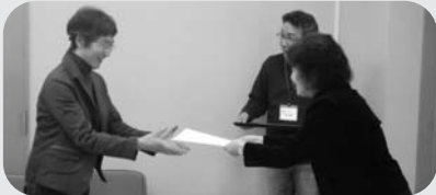
▲塾長から修了証を渡す

実践塾では、講座終了後も希望により、NPOでの一日体験やマッチングなどに応じるほか、年々一回の卒業後の交流会などおこない、卒業後のフォローに努めています。 第十一期は五月十一日(土)から七月三十一日(土)までです。好評を受けて募集人数を十八名に増やしました。みなさんも実践塾に参加して、自分自身に社会貢献を始めませんか? 詳しいみやぎNPO情報ネットをご覧ください。