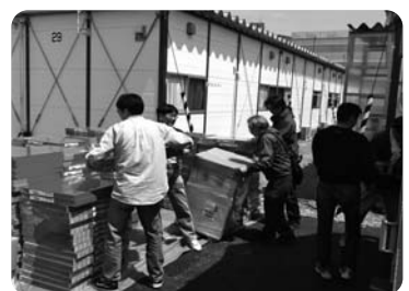
▲仮設住宅入居支援

現在、夜まわりグループの活動は、ほぼ通常のホームレス支援活動に戻っています。仙台市のホームレスは、統計だけ見ると減っているように見えます。し