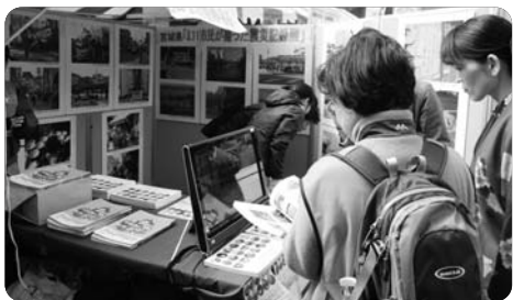
▲ 3.11 from KANSAI 写真展示の様子