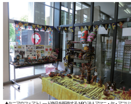
▲ケニアのフェアトレード商品を販売するNPO法人アマニ・ヤ・アフリカ