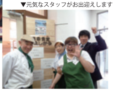
▼元気なスタッフがお出迎えます

福幸食堂 えしかる 〒983-0851 仙台市宮城野区榴ヶ岡5番地みやぎNPOプラザ内 TEL: 090-8617-1016 ランチ 11:30 ~ 14:00 夜の部 17:00 ~ 20:30 火~日曜日営業 (月曜定休日)