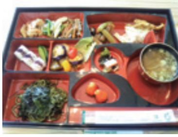
▲ワカメうどんメインの松花堂弁当

東日本大震災では、被災地の支援のため沿岸地域に駆けつけました。その時にワカメやメカブなど製品として市場で売られる残りの部分が廃棄されていくのを見つめます。昔は海に戻されてタコやウニの餌となって自然に帰されたものですが、現代では産業廃棄物処理法により海に戻せなくなり、自然循環されなくなっていたのです。そのままでは食べにくくとも、味が良く栄養のある自然の恵み。廃棄の量を減らして環境負荷を減らせないか、被災地の十三浜の特産品として仕事づくりに役立てられないかと考え、麺に練りこむことを考案しました。それに賛同した企業からうどんの製造機械を譲り受け、蔵王で生産された小麦粉を使い、山と海の恵みが素材の「ワカメうどん」を試作。その後、全国から駆